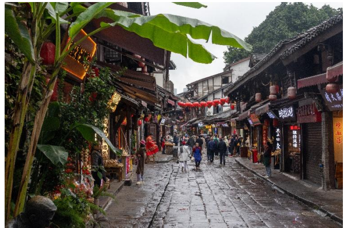
Ciqikou Altstadt in Chongqing