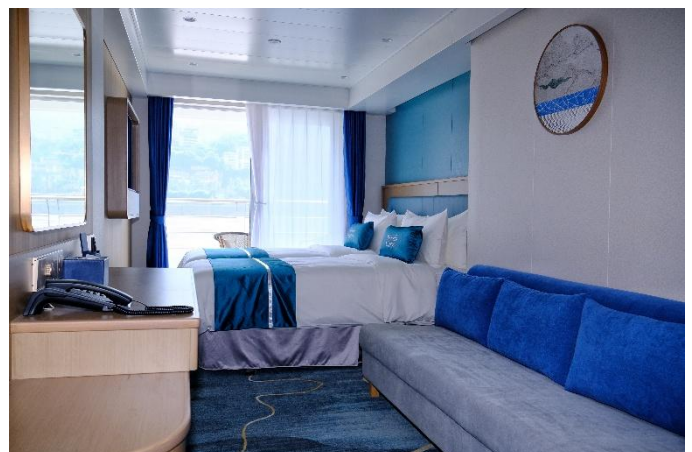
MS Victoria Isabella, Superior-Kabine