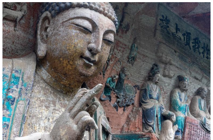
Felsskulpturen von Dazu

© Copyright – Alle Fotos sind urheberrechtlich geschützt und sind nicht zur Weiterverwendung gedacht. Veranstalter: GSW Touristik AG. Bitte beachten Sie die Geschäftsbedingungen unter www.gta.at/geschaeftsbedingungen/